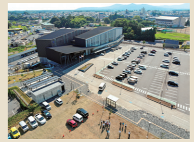
ドローンから撮影した石岡市役所

現在、講習を受けた職員33名でパイロットチームを組み活動中です。管理運営を事務局と操作班で分け、