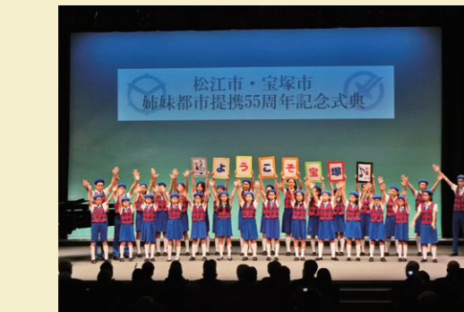
宝塚少年少女合唱団 (記念式典にて)