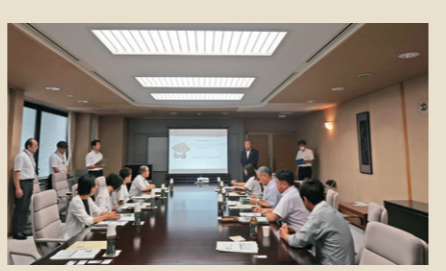
草津市「ICT教育の推進について」

保護者と学校間の欠席遅刻連絡・情報共有アプリは、市の予算で全校一斉に導入しています。このアプリは、民生委員など地域の方とも共有し、保護者と地域から「信頼される・応援される学校」の実現を目指しています。