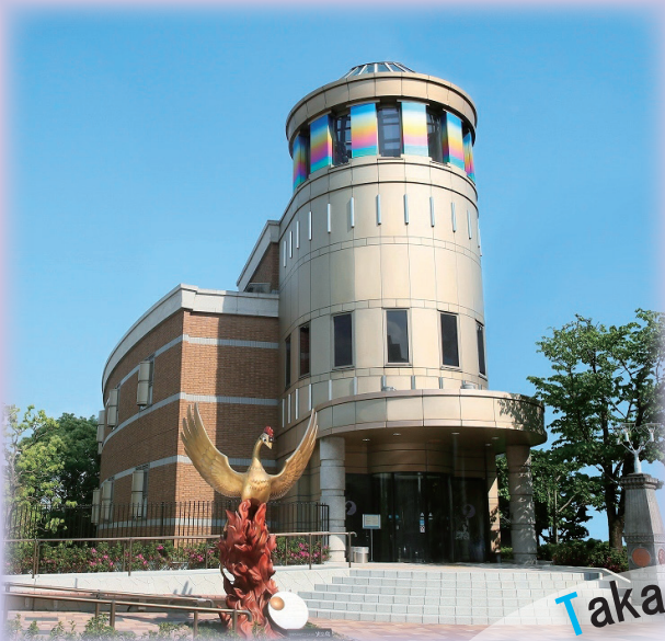
宝塚市：手塚治虫記念館