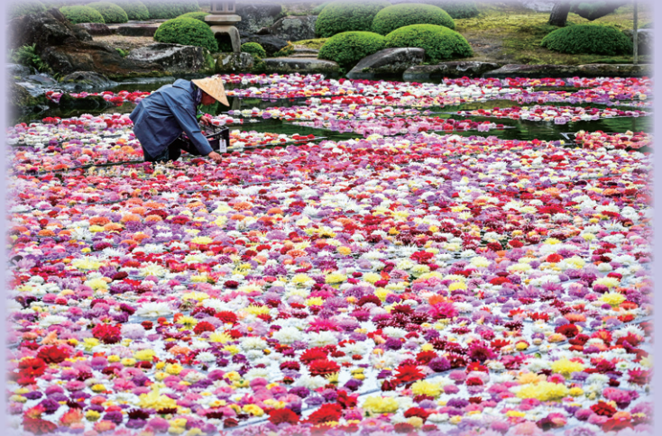
松江市：由志園の池に敷き詰められた宝塚のダリア

Takarazuka Matsue Matsue Takarazuka 姉妹都市提携 55周年