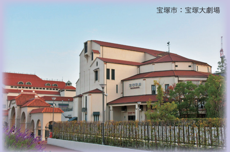
宝塚市：宝塚大劇場