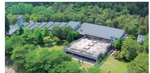
丹波少年自然の家

問 財産処分に伴う本市負担額の2750万円は、施設を解体し返却した場合と比べ安価なのか。 答 令和3年に行った解体費用の簡易見積もりは2億8千万円以上と見込まれていた。