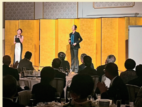
宝塚歌劇団OG歌唱 (レセプションにて)