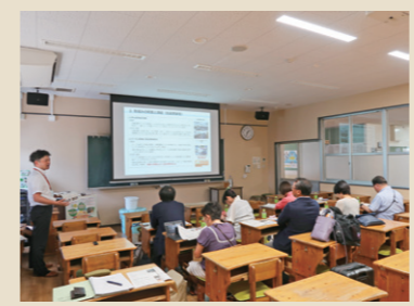
廃校を利用した施設で説明を受けました

そこで、福岡県みやま市に伺い、山間地域の生活の足の確保・物流の確保に利用されている「自動運転サ