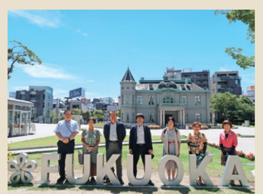
貴賓館を望む天神中央公園