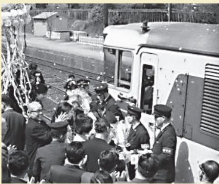
昭和41年(1966年) 特急やくもが宝塚駅初停車

また、「災害時相互応援協定」を締結するなど、さらなる「絆」の構築に向けて取り組んでいます。