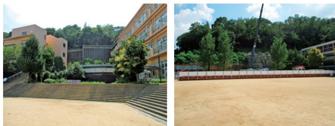
のり面に設置する崩壊土砂防護柵工事に必要な作業構台を施工中

問 樹木伐採の仕方により、のり面の強度が弱くなる恐れがあると思うが、必要最小限の範囲の樹木を伐採するが、根は残している。