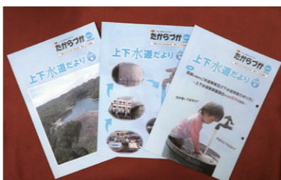
上下水道だより(特別号)

健全な水道を次世代へ引き継いで行けるよう、市民の理解を深めるためのさらなる説明を強く求めるものがある。 以上決議する。