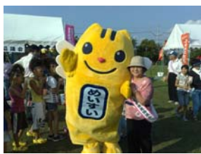
めいすいくんとパチリ

来年度サマーフェスタ出展の際には、是非、また御参加いただきますようお願いいたします。