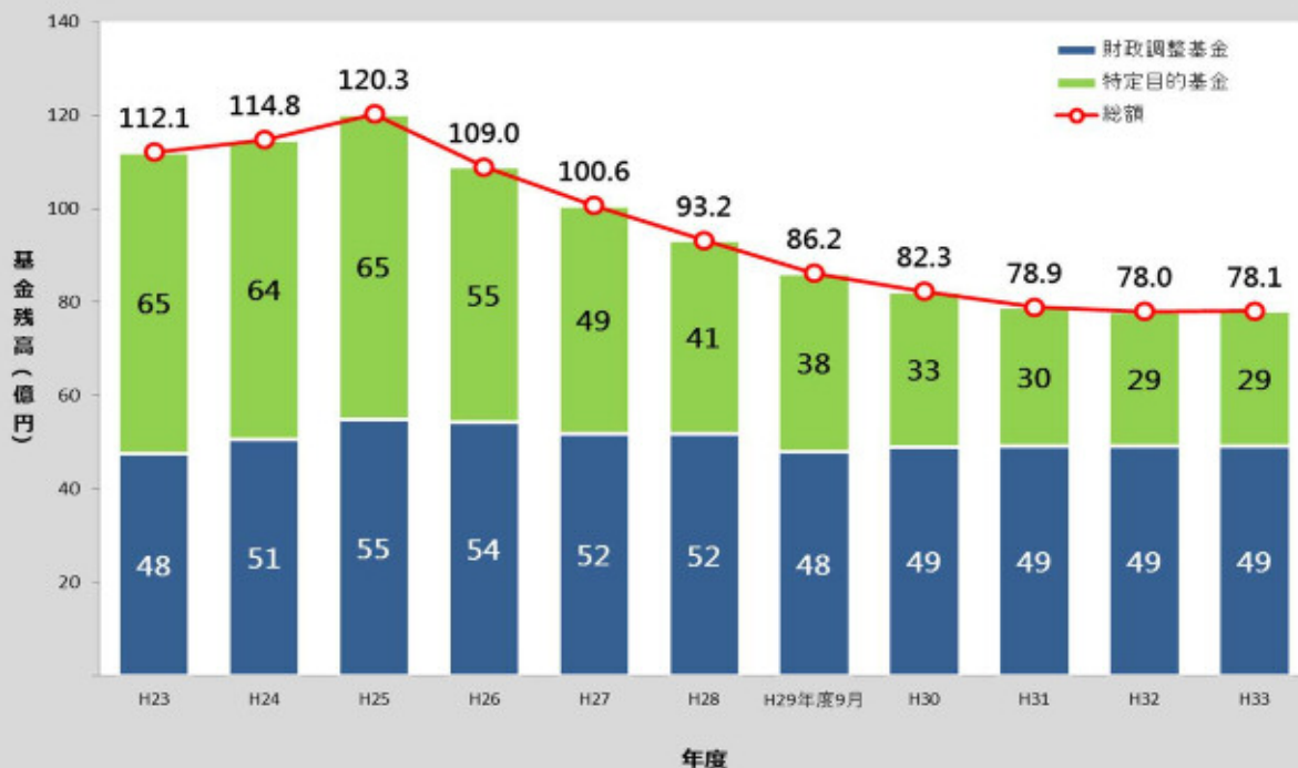
基金残高の推移と見通し