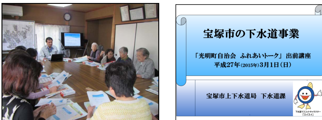
図- 31 出前講座の状況

出前講座では、今後はワークショップ形式を取り入れるなど、講座内容の充実を図り、市民による下水道の「自分ゴト化」の醸成を目指します。