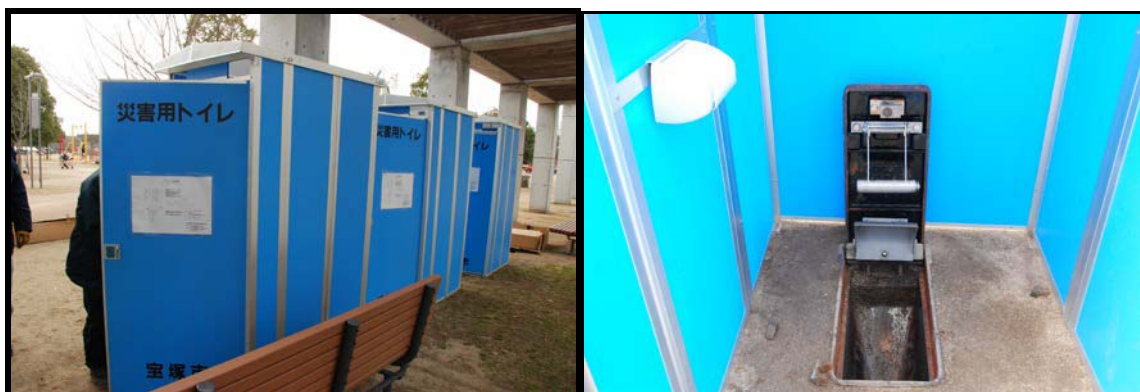
図- 33 下水道管への直結仮設トイレ

市では毎年1月に総合防災訓練を実施しています。訓練は拠点指定避難所である末広中央公園で行われ、近隣の自治会の方々も多く参加し、応急給水訓練や消火訓練などに取組んでいます。末広中央公園では、避難者向けに下水道管への直結仮設トイレが設置できるよう整備しています。