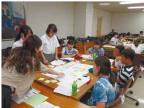
7月21日 事前学習会の様子