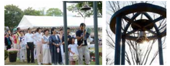
人権男女共同参画課(☎77・9100 FAX77・2171)

広島原爆忌 8月 6日(日) 8時15分 長崎原爆忌 9日(水) 11時2分 終戦記念日のつどい 15日(火) 14時(上記) 国際平和デー 9月 21日(木) 正午