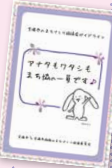
宝塚市のまちづくり協議会ガイドライン

「まちづくり協議会(まち協)」を知らない人も、そうでない人も「まち協」のことがよく分かります。冊子は市民協働推進課、宝塚NPOセンターで、チラシも市内の各公共施設で配布していますので、ぜひご利用ください。