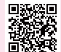
まち協ポータルサイト