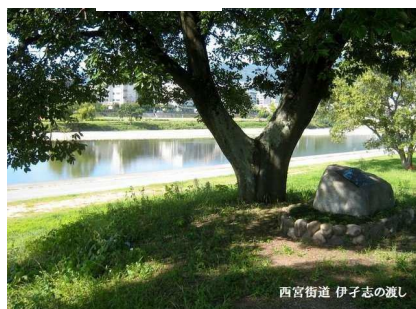
西宮街道 伊子志の渡し