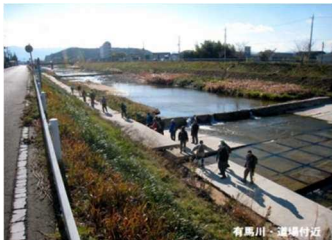
有馬川・道場付近