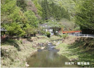
羽束川・籠初温泉