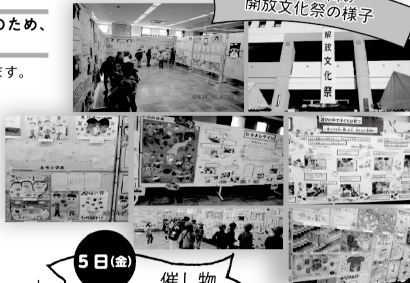
昨年及び一昨年の開放文化祭の様子