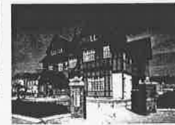
門司港レトロエリア(北九州市)