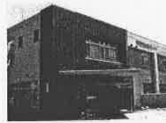
横浜市 白幡地区センター