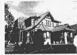
文化のみち二葉館(名古屋市)