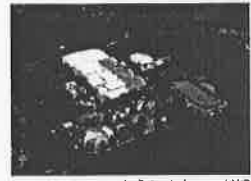
ならシルクロード博