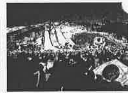
長野冬季オリンピック