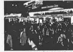
FIFAワールドカップ埼玉スタジアム