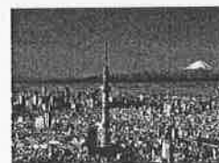
東京スカイツリー