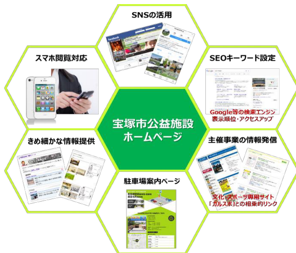
【新規開設するホームページの主なコンテンツ】

また、私たちは、新たに本施設独自のFacebookやInstagram等を開設し、SNS（ソーシャル・ネット・ワーキングサービス）を活用したタイムリーな情報を発信していきます。SNSは、拡散性の高い媒体のため、口コミ同様、認知度を向上させることができると期待しています。