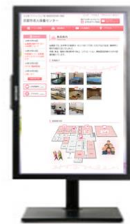
【デジタルサイネージ】