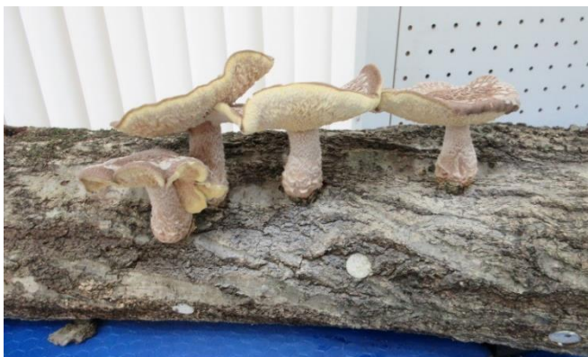
西谷で栽培された原木椎茸 (上写真)