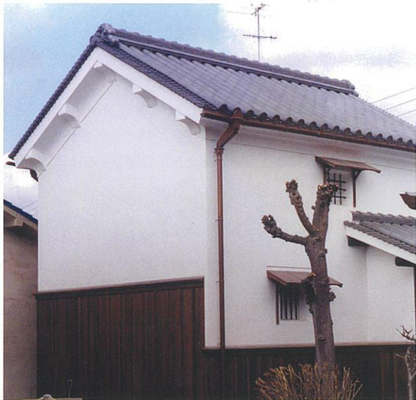
旧和田家住宅土蔵