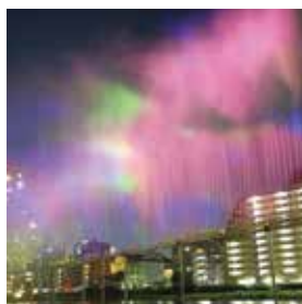
武庫川河川敷 yojic14さん

Instagramを通じて市内の写真を投稿していただく「たからづかなフォトグラファー」を随時募集しています。