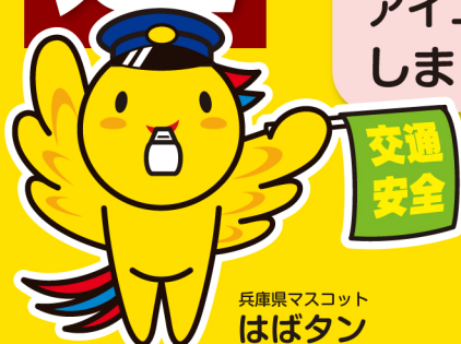
兵庫県マスコット はばタン