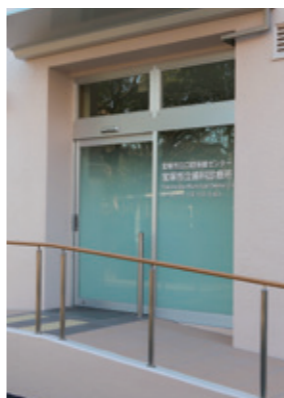
新しい歯科診療所 (入り口付近)