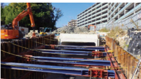
荒地西山線の工事の様子