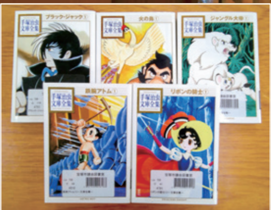
手塚治虫氏の漫画もずらり！

蔵書数は約5300冊（令和3年12月31日現在）。官報・公報のほか、政治社会経済や地方財政等の白書、行政雑誌、法律や議会関係の専門書、映像資料など市議会や宝塚市に関するさまざまな記録を備えています。