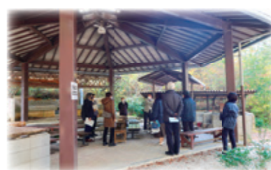
現地調査で説明を受ける文教生活常任委員会委員