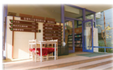
宝塚自然の家 管理棟