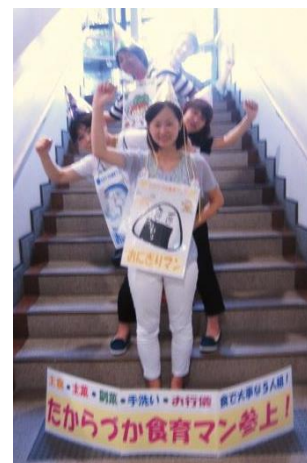
「食」で大事な5人組 たからづか食育マン参上！