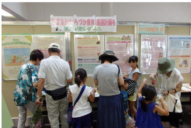
「第2次たからづか食育推進計画」を策定しました。 計画パネルを見ながら、クイズに奮闘中？