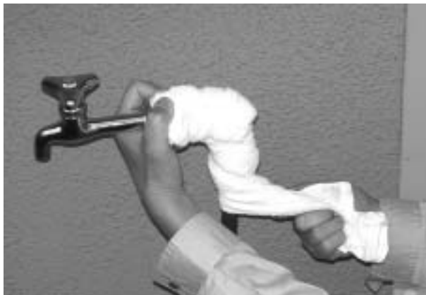
水道管にタオルを巻いて凍結防止