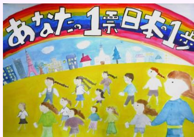
《伊達 千尋さんの作品》