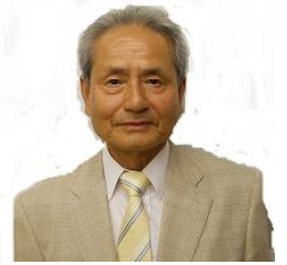
宝塚市明るい選挙推進協議会