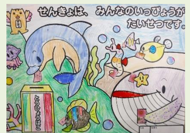
《にしお かなさんの作品》