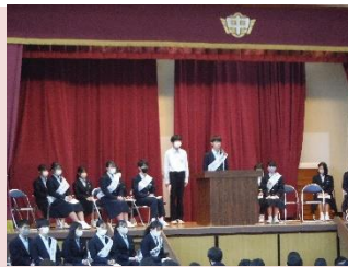
↑立候補者演説会の様子

今年度は12月1日に市立高司中学校で実施しました。立候補者演説会から投票まで真剣に取り組んでいる様子を見て、とても頼もしく感じました。