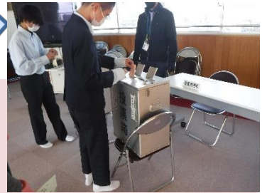
↑生徒会選挙 投票の様子