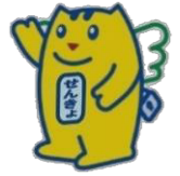
明るい選挙のイメージキャラクター 選挙のめいすいくん

明るい選挙啓発推進員は、明るい選挙推進協議会を補助し、明るい選挙啓発に寄与するため、選挙時における街頭啓発等の啓発活動を行っています。