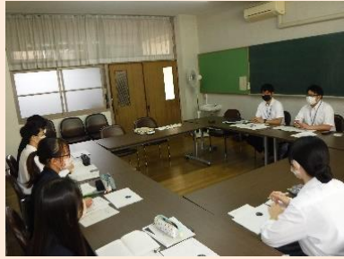
↑ディスカッションの様子

今年度は9月15日に兵庫県立宝塚高等学校で、3年生の生徒5名と選管職員との活発なディスカッションが行われました。