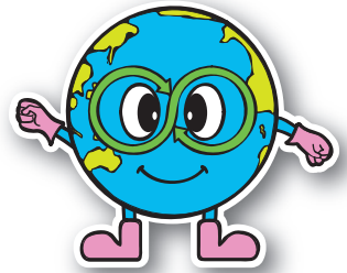
シンボルキャラクター「あーすちゃん」

「小型家電リサイクル法」が平成25年4月1日に施行されたことに伴い、 宝塚市では7月より「小型家電回収実証事業」がスタートします。 ご家庭で不要になった小型家電をリサイクルしていただき、 資源の有効活用にご協力ください。