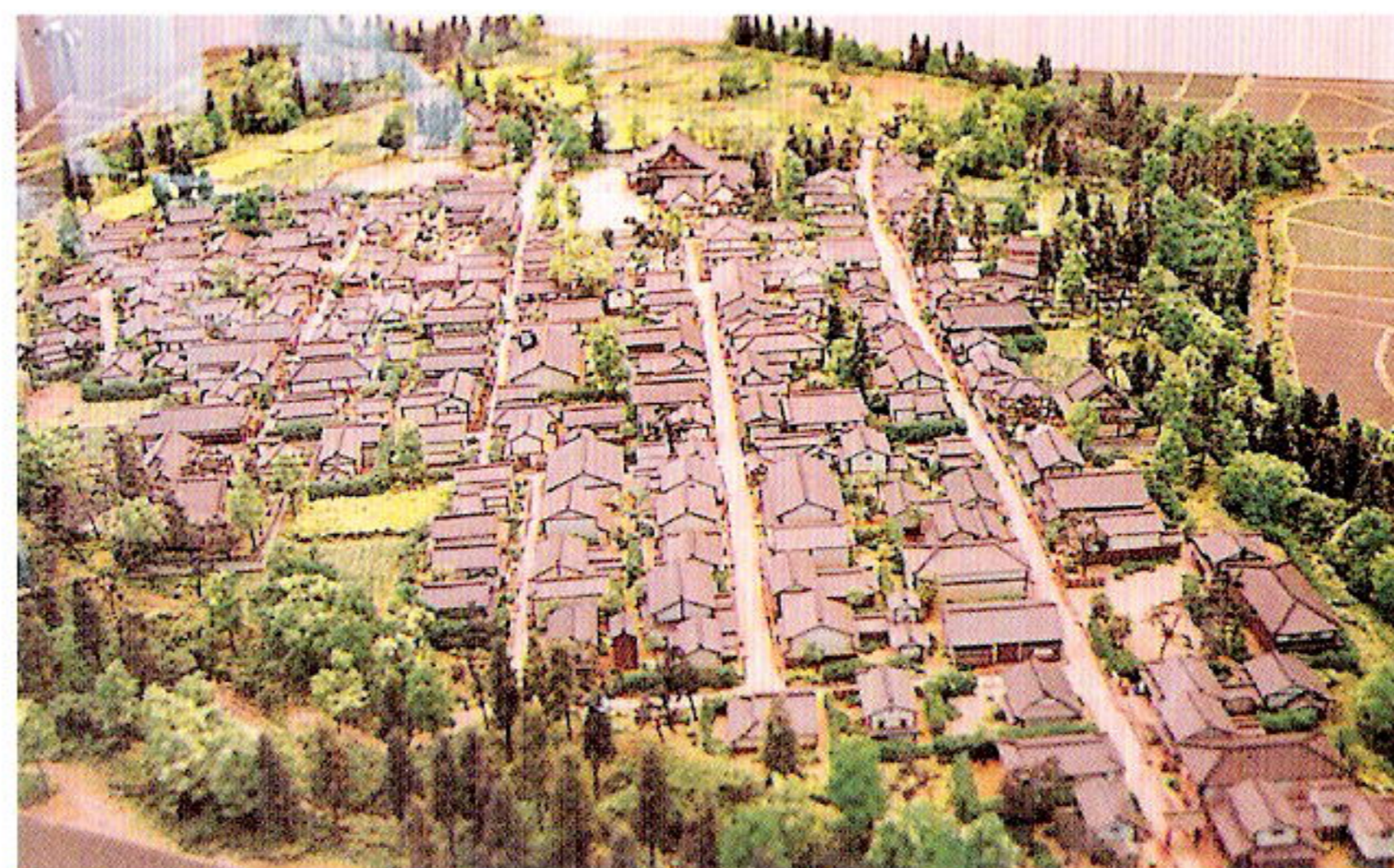
小浜の町並み模型

町家は、江戸後期以降のものがあり、通り土間型式を主として、虫籠窓や格子戸などのたたずまいを残しています。