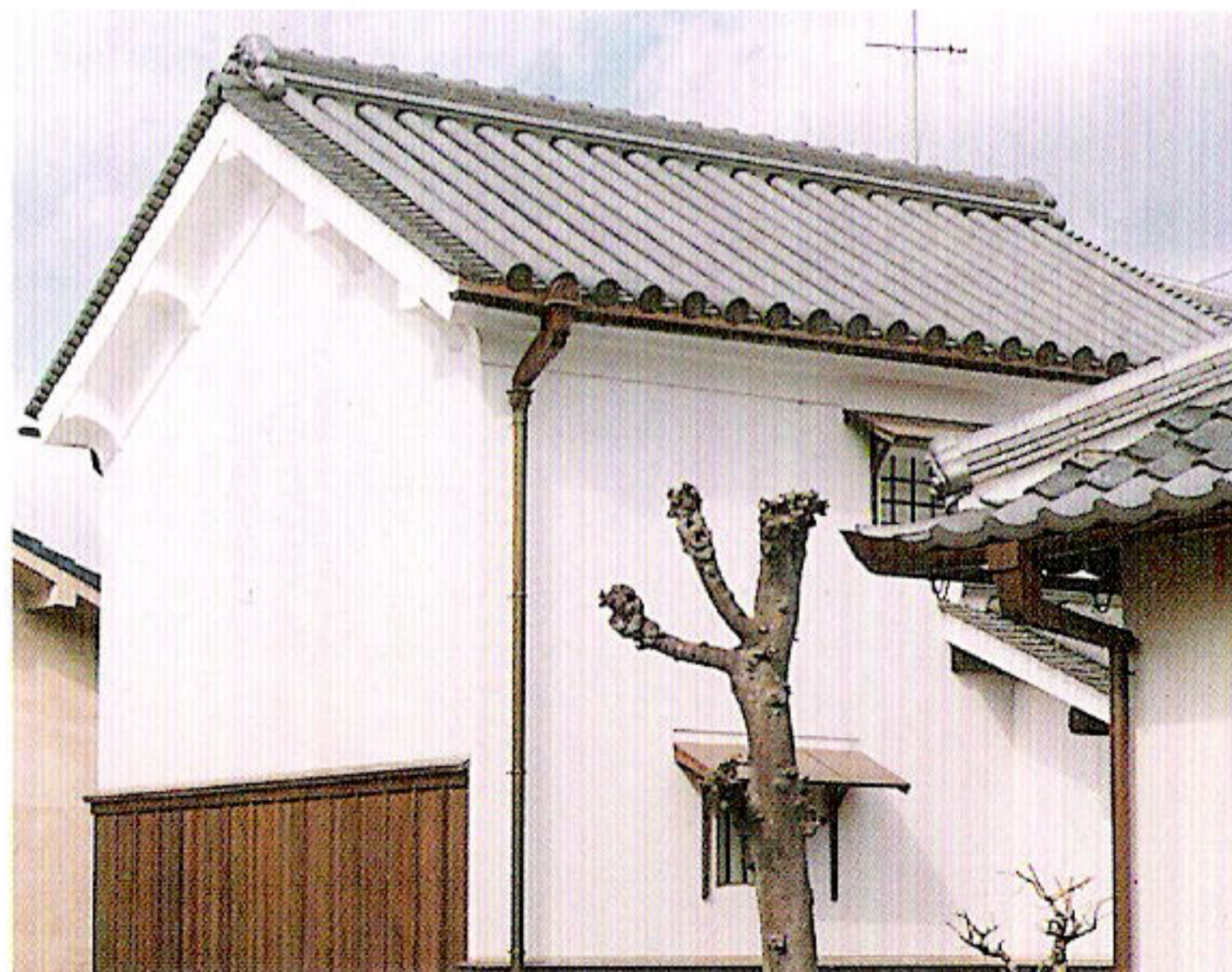
旧和田家住宅土蔵