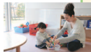
きらきらひろばプレイコーナー