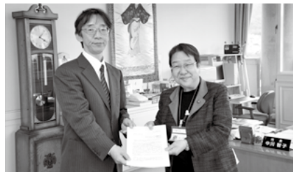
▲丸山会長から市長への中間答申(2月13日)

この条例案をもとに議会への提案を検討しており、条例案に対して市民の皆さんなどから広く意見や情報をいただくため、パブリック・コメントを実施することになりました。(本誌16ページ)。また、並行して推進のためのビジョン(計画)づくりにも着手しています。