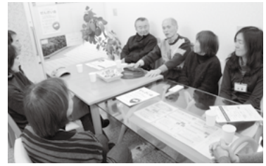
▲すみれが丘に新しい地域の居場所ができました

場所：すみれが丘2丁目 ☎090・3613・3258 (月～金曜13時～16時) 利用料無料(お茶代100円)