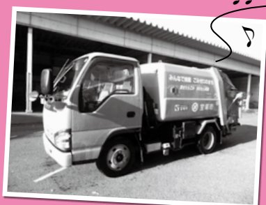
クリーンセンター業務課(☎87・7883)