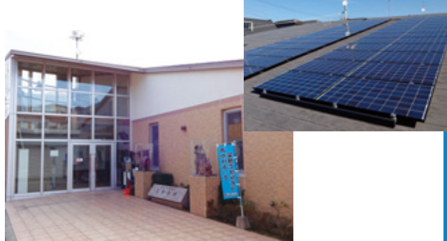
▲今年2月に太陽光発電システムを設置した高松会館

今回の取り組みについて、高松町自治会からは「市民と市の協働を改めて実感した!」という感想をいただいております。市と役割分担をしながら、持続可能なまちづくりのために環境の取り組みを実践するという新しい形の協働と言えます。