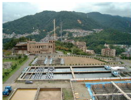
（浄水場の運転管理）