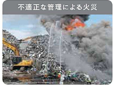
不適正な管理による火災

環境対策を行わずに廃家電を破壊することで、フロンガスや鉛などの有害物質が環境中に放出されます。