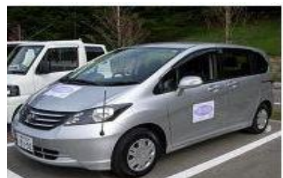
すみれ墓苑送迎車(最大6名乗車可能です)