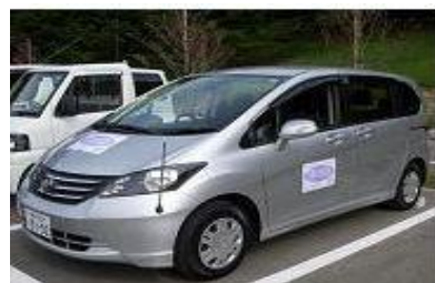
すみれ墓苑送迎車(最大6名乗車可能です)