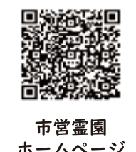
市営霊園ホームページ

宝塚市役所 生活環境課 ☎ 0797-77-2073 (長尾山/西山霊園担当) ☎ 0797-77-2146 (宝塚すみれ墓苑担当)