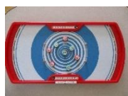
シャッフルショット