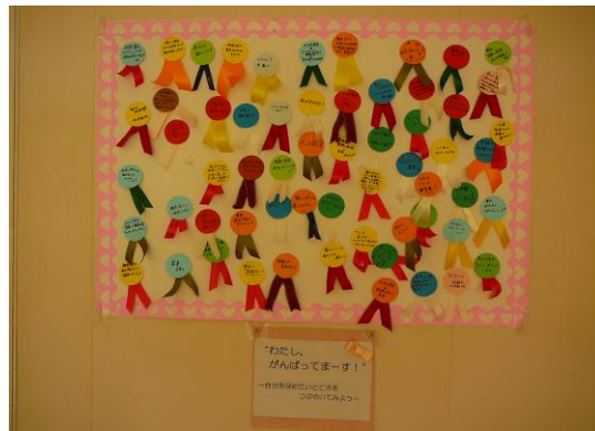
「わたし、がんばってまーす！」 —子育てのつらさを乗り越えるために—