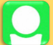
関学3年 パルふれ歴3年

スポーツ、音楽、料理、ゲーム、ダンス、イラストなどなど自分の特技を子どもとの関りの中で活かせるよ。