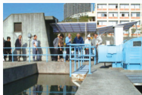
下水道施設見学会の様子

平成28年 7月 事業の概要説明 10月 水道施設見学会 11月 下水道施設見学会 平成29年 1月 意見交換会 3月 利き水会