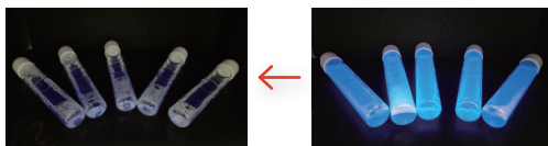
浄水処理後の水道水