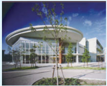
プレミア宝塚外観

宝塚市内在住・在学・在勤の18歳未満の子ども及び18歳未満の子どもが通学等できる施設(高等学校、高等専門学校等)に通う19歳までの者を対象とし、子どもの気持ちを早期に受け止め、相談に応じるだけでなく、子どもの最善の利益を実現していくことを目的とし、関係機関との調整を行ったり、救済の申立て等により、調査したり、関係機関への協力や改善を求めています。子ども自身が本来持っている力を十分に発揮できるよう、問題解決に向けた支援を行います。