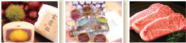
追加する記念品のイメージ

11月1日から、ふるさと納税の記念品を拡充します。あわせて、記念品の対象者を市外在住者だけでなく市民の皆さんにも拡大します。宝塚大劇場の公演チケットやブルーレイ、手塚治虫のマンガ本のほか、宝塚ゆかりの品を多数ご用意しています。ふるさと納税で、お得に宝塚市を応援してください!