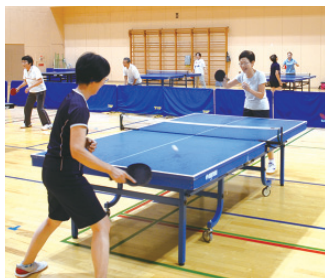
まずは気軽にスポーツセンターへ♪

今回の特集テーマは「スポーツの秋」。取材を通して、スポーツに打ち込む皆さんの真剣なまなざしや合間にこぼれる笑顔など、たくさんの素敵な表情に出会うことができました!健康のためや、趣味・友人を作りたいなど、スポーツを始めるきっかけは人それぞれ。今回の特集を通して、皆さんがスポーツの魅力に触れ、スポーツを始めるきっかけになることを願っています。(堀)