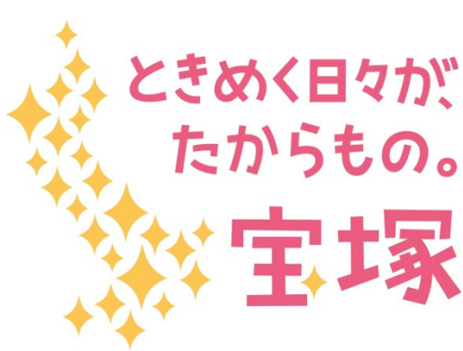
デザイン1（基本デザイン）