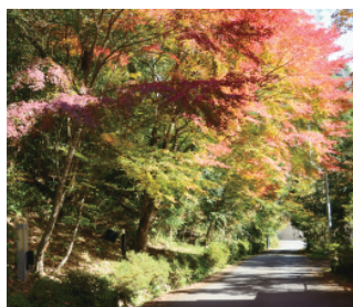
武田尾が赤や黄に染まるとき

今回、「湯のまち宝塚」の特集を組むにあたり、2軒の温泉宿に実際に宿泊させていただきました取材を行いました。入浴客がいない深夜の大浴場や朝晩の景色、普段撮影することのない“料理”の写真撮影などに追われ、楽しみつつもハードな取材となりました。街なかの宝塚温泉と、大自然に囲まれた武田尾温泉…。身近にある2つの温泉へ市民の皆さんにもぜひ実際に足を運んでいただけたらと思います。(清)