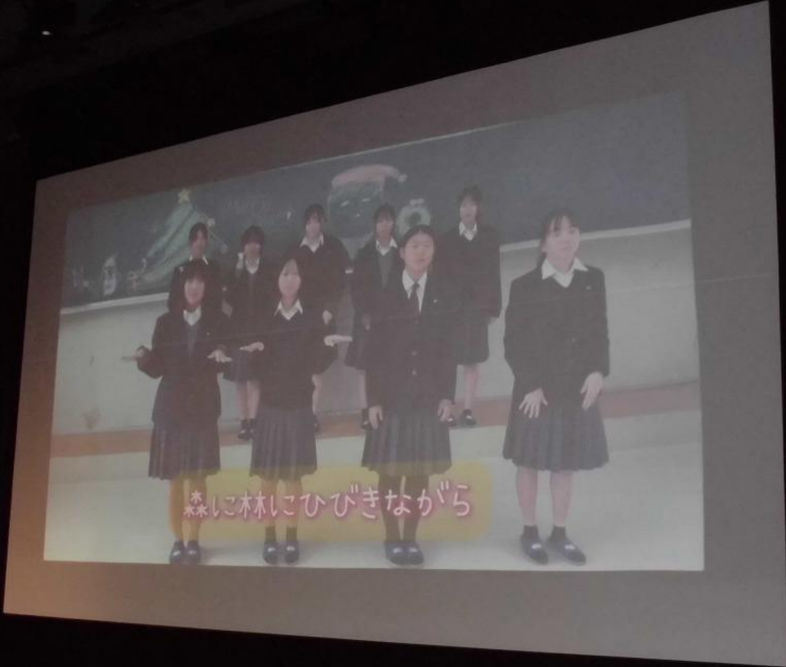
森に木にひびきながら