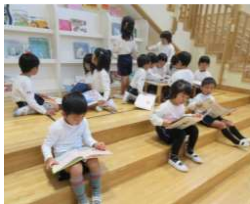
長尾幼稚園の図書コーナーで思い思いに本を読む子どもたち

c 児童館では絵本購入のほか、市立図書館のリサイクル図書を活用して蔵書を充実させました。