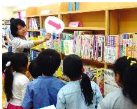
長尾小学校の学校図書館でのオリエンテーション。本の探し方を学びます