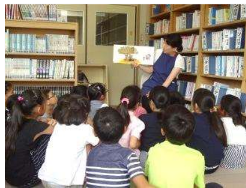
山手台小学校の学校司書によるおはなし会

平成22年度に、すべての小・中学校36校に学校司書を年間60日配置し、平成28年度からは、年間130日配置に拡充しました。