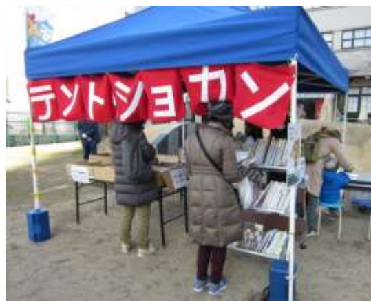
テントショカンで、リサイクル図書を選んでいきます