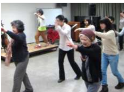
ボランティア対象の「あそび歌セミナー」では、体を動かしてあそび歌を体験