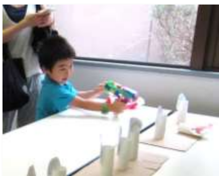
「てづくりの時間」で、自分で作ったペットボトル砲を試し打ち！