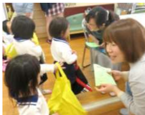
西谷幼稚園で絵本を借りる子どもたち

(ウ) 絵本リーフレットを活用した絵本の紹介を行うほか、地域の子育て家庭の親子を対象とした読み聞かせを実施します。