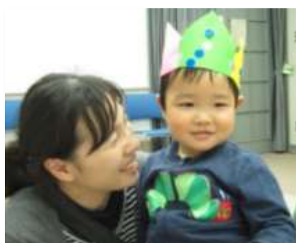
「2歳からのみんなであそぼ」で、お母さんと作った冠がお気に入り