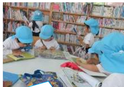
宝塚幼稚園は、中央図書館を見学。借りる絵本を真剣に選びます

日々の保育・教育活動の中で行う、発達段階に応じた絵本の読み聞かせを支援するため、季節の絵本や新刊絵本の推薦絵本セットの団体貸出等を積極的に進めます。また、図書館見学を積極的に受け入れます。