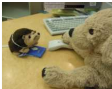
毎年大人気の「ぬいぐるみのおとまり会」では、ぬいぐるみが図書館を探険します