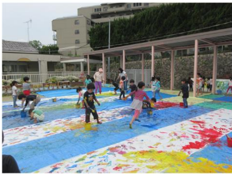
市立幼稚園での一日 (※ほんの一例です)

詳しくは「宝塚市立幼稚園預かり保育(のびっこひろば)のご案内」をご覧ください。 ※実際にかかった費用と「利用日数×450円」を比べて、低い金額が無償化の対象となります。