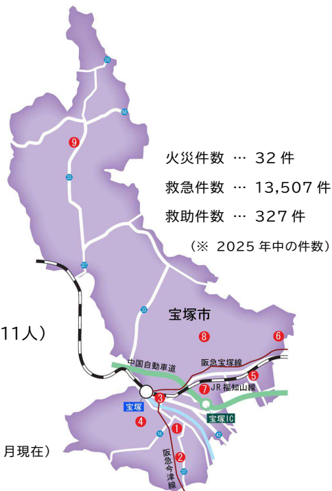
消防本部・西消防署合同庁舎

消防職員 … 246人(うち女性11人) 緊急車両 … 38台 管轄面積 … 101.89 km 2 人口 … 219,061人 (※ 2026年4月現在)