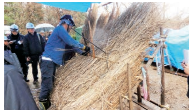
職人による実演の様子(2月16日見学会)

民俗文化財とは衣食住・生業・信仰・年中行事等に関する風俗習慣・民俗芸能・民俗技術およびこれらに用いられる衣服・器具・家屋・その他物件など人々が日常生活の中で生み出し、継承してきた有形・無形の伝承で人々の生活の推移を示すもののことを指します。