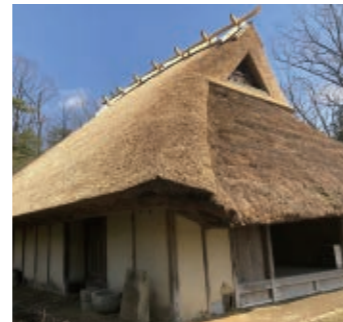
葺き替え後の旧東家住宅(北西から)

旧東家住宅は、大原野の宝塚自然の家内にある歴史民俗資料館です。昭和51(1976)年に現在地へ移築・復元され、資料館として開館しました。江戸時代中期頃に建てられたとされ、北摂地域の中流階級の代表的な農家として、昭和53(1978)年に県指定重要有形民俗文化財に指定されました。これまで「差し茅」という部分的な修繕を行ってきましたが、寿命のため特に劣化が著しい東面・北面・棟部分の葺き替えを約40年ぶりに行いました。今年2月16日には見学会が開催され、職人さんによる屋根の模型を使った葺き替え作業の実演の見学や、茅葺についての話をいただきました。参加者からは「間近で作業が見られてよかった」「見学できてよかった」などの声を頂きました。