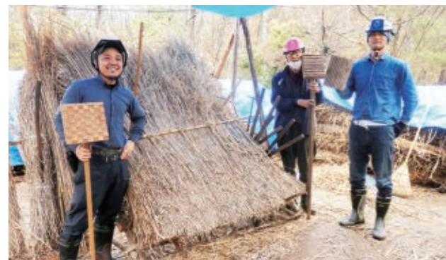
葺き替え作業を担当した西嶋工務店・淡河かやぶき屋根保存会「くさかんむり」の職人の皆さん

現在の旧東家住宅は、新しく葺き替えられた面と、約40年経過した面を見比べることの出来る珍しい形になっています。