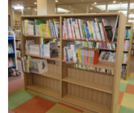
図書館の本棚・本の購入