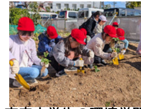
市内小学生の環境学習 (宝交早生苺プロジェクト)