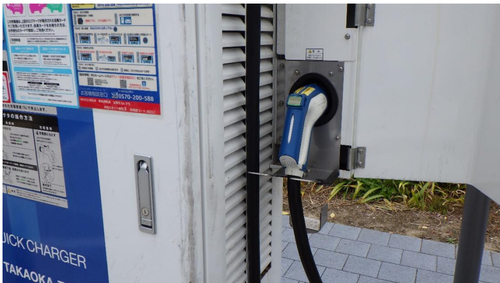
急速充電設備のコネクター