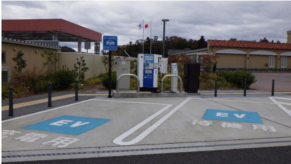
急速充電設備の周辺環境