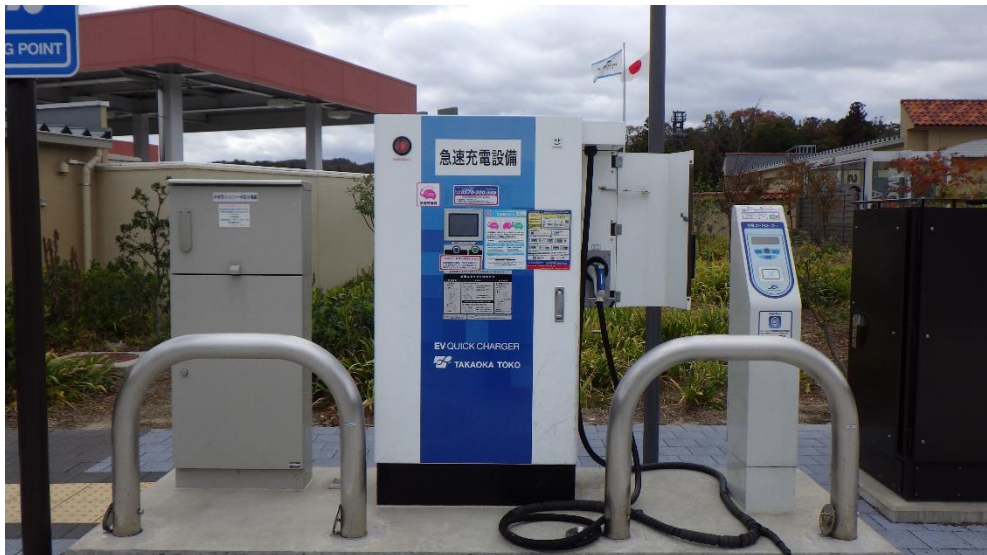
急速充電設備の外観