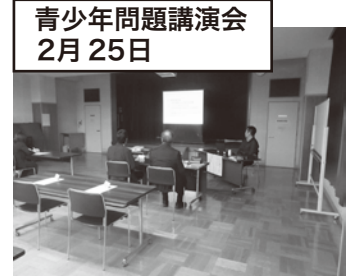
青少年問題講演会 2月25日