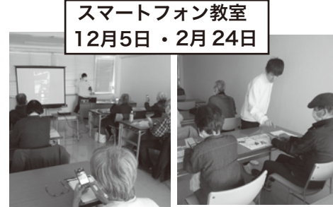
スマートフォン教室 12月5日・2月24日