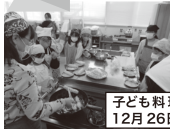
子ども料理教室 12月26日