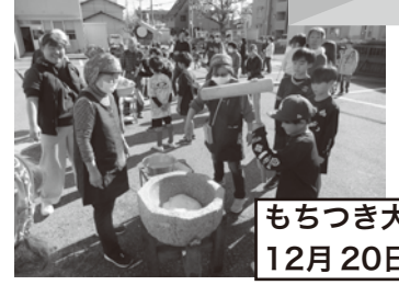
もちつき大会 12月20日