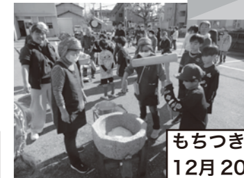
もちつき大会 12月20日