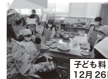
子ども料理教室 12月26日