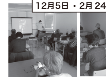
スマートフォン教室 12月5日・2月24日