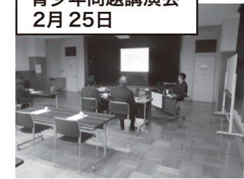
青少年問題講演会 2月25日